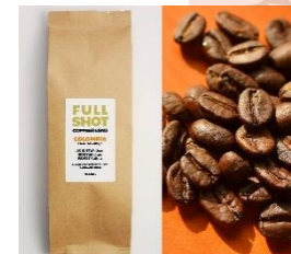
FULLSHOT COFFEE BEANS