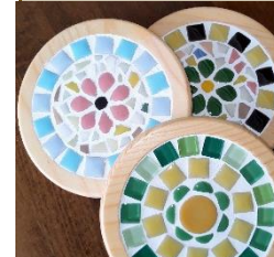
タイルクラフト ゆきだるま