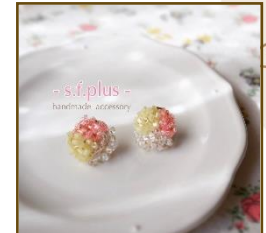
-s.f.plus- handmade accessory