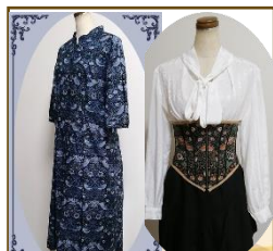
アトリエファソナ