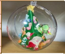
わたがし&ゆきうさぎ