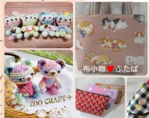
布小物♥ふたば& Zoo Craft+