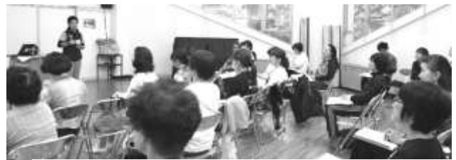
「PPK(ぴんぴんキラリ)体操」は (公財)社会教育協会の登録商標です。