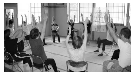
実習風景(イメージ)

※問い合わせ先：ひの社会教育センターまで —介護予防運動インストラクター資格認定協会—